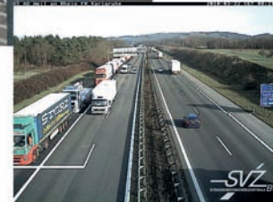
Webcams zeigen den Verkehrsfluss auf Autobahnen