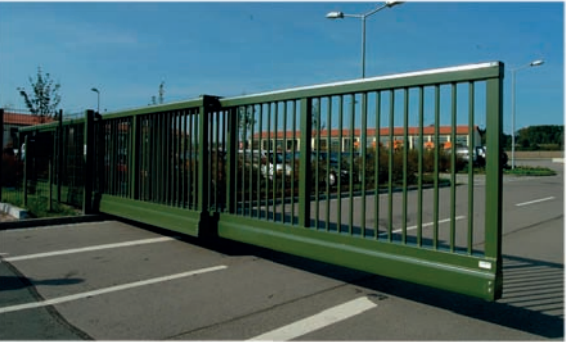
Schiebetore, Drehtore, Teleskoptore