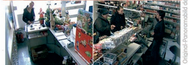
Hemispheric = 180°-Panoramabild und zwei weitere Bildausschnitte