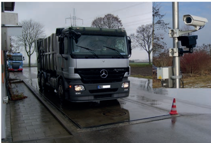
Waage und Kennzeichenerkennung