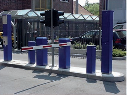
Schranken und PKW/LKW Standsäulen