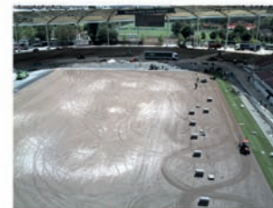
Dokumentation vom Baufortschritt