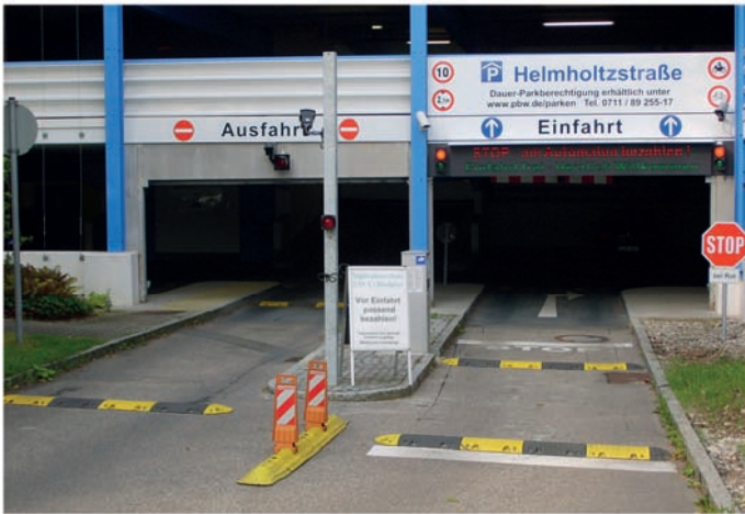
kontrollierte Einfahrt ohne Schranken